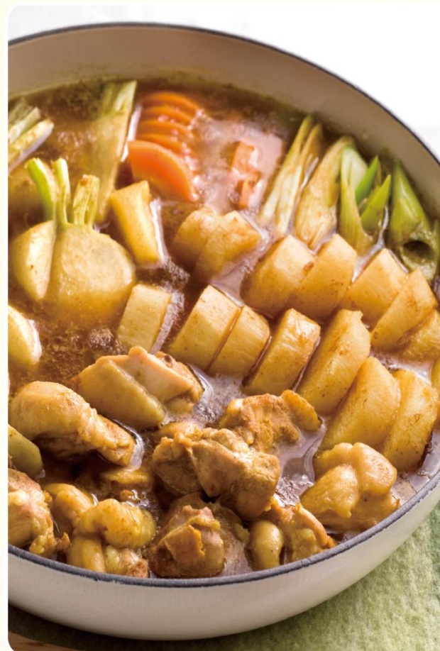
レシピ提供: ベターホームのお料理教室 http://www.betterhome.jp